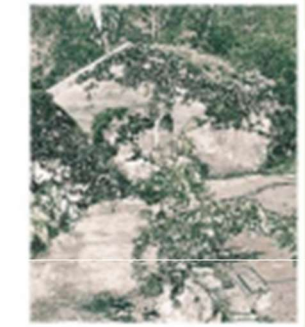
9 - Le lavoir

Retrouvez les hébergements, les artisans et notre actualité sur : chedigny.fr