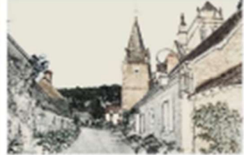
3 - L'église Saint-Pierre-de-Lanis