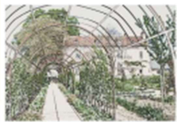
1 - Jardin de nuit