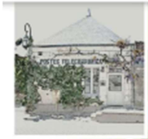
7 - Agence Postale Communale