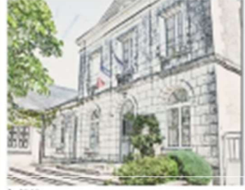
6 - Mairie