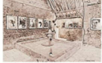
10 - Le Pressoir : exposition