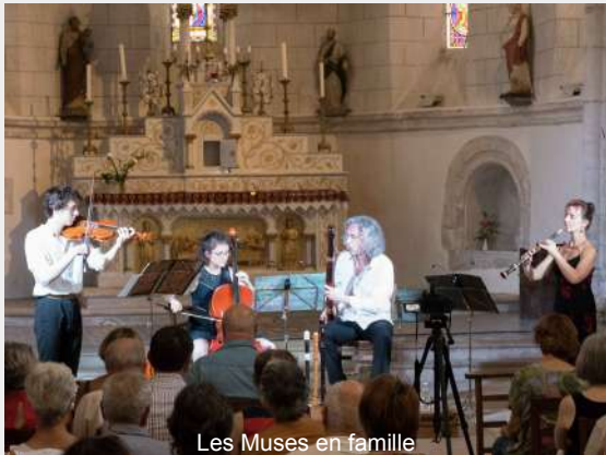
Les Muses en famille