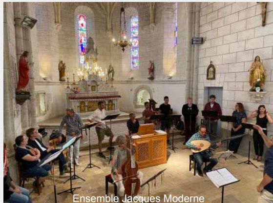
Ensemble Jacques Moderne