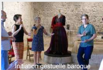
Initiation gestuelle baroque