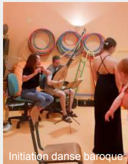
Initiation danse baroque