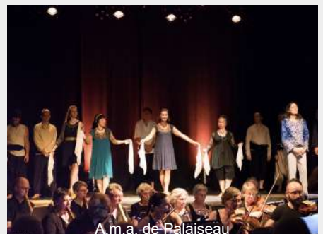
A.m.a. de Palaiseau