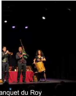
Le Banquet du Roy