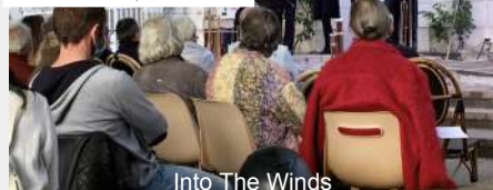
Into The Winds