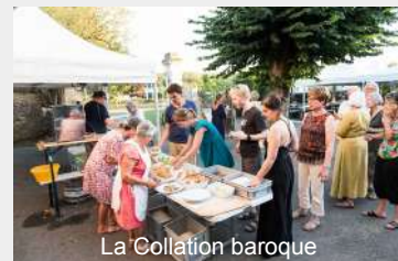
La Collation baroque