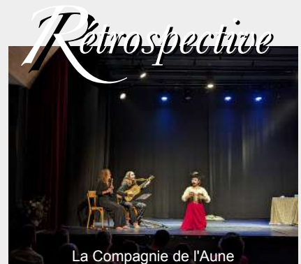
La Compagnie de l'Aune