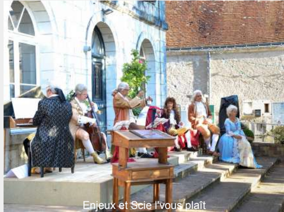
Enjeux et Scie l'vous plaît