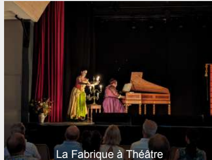
La Fabrique à Théâtre