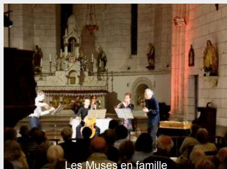
Les Muses en famille