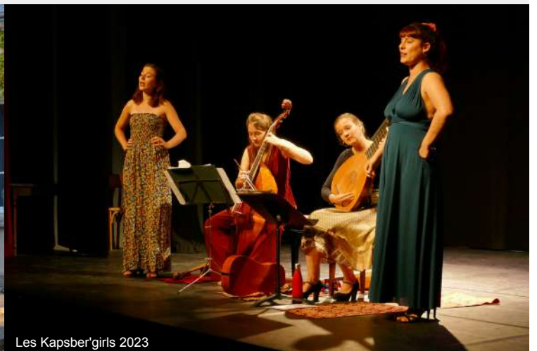
Les Kapsber'girls 2023