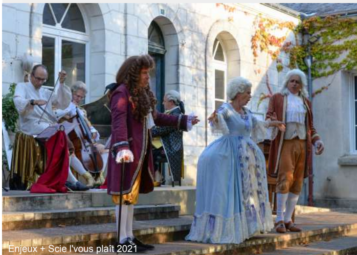
Enjeux + Scie l'vous plaît 2021

Le festival Regards baroques de Chédigny est fait d'ouverture d'esprit, et réserve aux artistes et au public un accueil simple, enthousiaste et chaleureux.