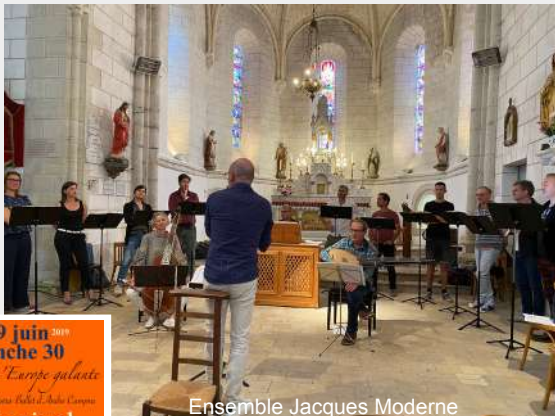
Ensemble Jacques Moderne